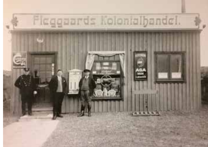
Fleggaard Holding A/S.

■ There are many traces of colonial history in the Sønderjylland-Schleswig region. In recent years, researchers from various disciplines have been looking for colonial connections in the German-Danish borderland. As a result of their work, a richly illustrated anthology now presents a panoramic collection of this research. In more than 20 papers, the contributors look at the architecture, tell the story of our consumption, present ways of life or take a critical look at our memory culture. They bring long forgotten events to life, or set wellknown phenomena in a new framework. In this way, it becomes clear how the colonial system shaped our world and how it still plays an important role in our everyday life..